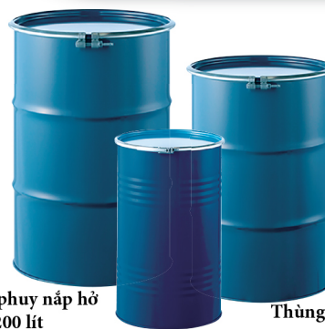
Thùng phuy nắp hờ 200 lít